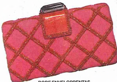
RODE ENVELOPPENTAS MALIPARMI: 210 EURO.