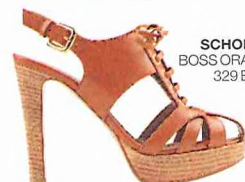
SCHOENEN BOSS ORANGE: 329 EURO.