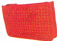
ENVELOPPENTAS FOREVER 21: 12,90 EURO.