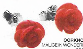
OORKNOPJES MALICE IN WONDERLAND: 55 EURO.