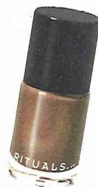
NAGELLAK RITUALS: 11,90 EURO.