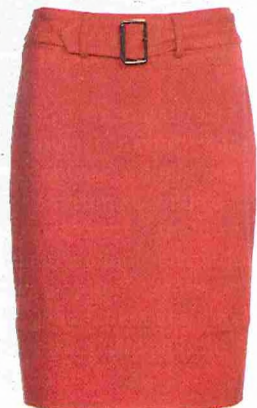
RODE ROK - CAROLINE BISS: 160 EURO.