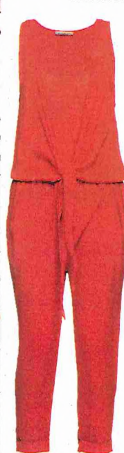
RODE OVERALL PINKO: 215 EURO.