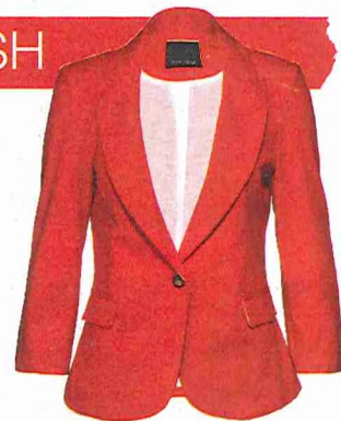
RODE BLAZER NEW YORKER: 34,95 EURO.