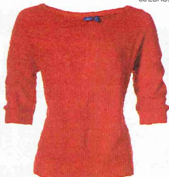
ROOD TRUITJE - MEXX: 59,95 EURO.