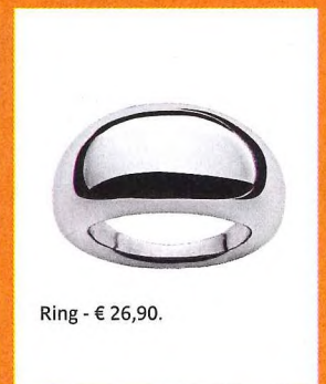
Ring - € 26,90.

Neem een kijkje op venizi.com voor een filiaal in jouw buurt. Flairvoordeel: -30% op de staalcollectie op vertoon van je Flairbon. Betaalmogelijkheden: cash, Bancontact, Visa.