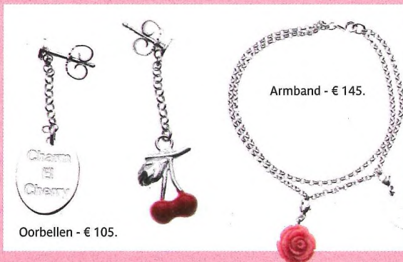
Oorbellen - € 105.

Het juwelenmerk Malice in Wonderland bestaat twee jaar. Reden om te feesten! Omdat presentatrice Evy Gruyaert geen juwelen kon vinden die helemaal naar haar zin waren, besloot ze zelf aan het ontwerpen te slaan, met tijdloze zilvercollecties als resultaat. Helemaal haar ding, en vast ook dat van jou!