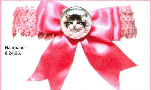
Haarband - € 24,95.

Opgelet! Glam at Heart is alleen voor cutie pies . Deze super-schattige winkel heeft een verrassend aanbod aan juwelen waarvan je lekker kan smullen. Kettingen in de vorm van cupcakes, een appeltje als ring? Na een bezoek aan deze webshop voel je je meer girly dan ooit tevoren.