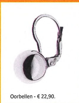
Oorbellen - € 22,90.

Bij Venizi beperken ze zich niet tot één type juweel. Trends worden gevolgd, maar niet tot in het oneindige. Goed nieuws, want dat betekent dat je jouw juwelen heel lang kan blijven dragen. Viva Venizi!