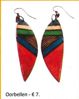
Oorbellen - € 7.

De sieraden uit deze feeëriek winkel komen rechtstreeks uit Colombia. Daar worden ze gemaakt door locals die gepassioneerd zijn door verschillende kleuren en materialen, die ook nog eens ecologisch verantwoord zijn. Gegarandeerd unieke stukken!