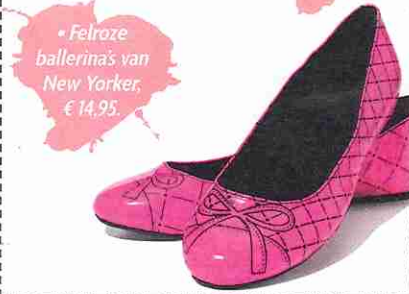
• Felroze ballerina's van New Yorker, € 14,95.