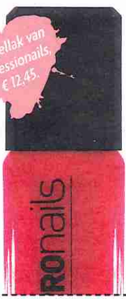
• Nagellak van Professionalis, € 12,45.