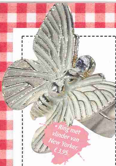
• Ring met vlinder van New Yorker, € 3,95.