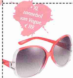
• XL zonnebril van Vogue, € 119.