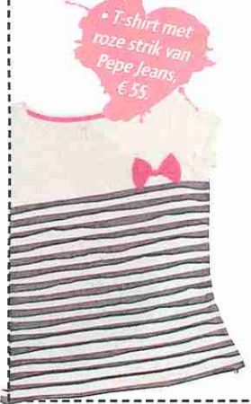
• T-shirt met roze strik van Pepe Jeans, € 55.

VERKOOPINFO: ACCESSORIZE.COM • ART'EMI BIJ JPG WATCHES: 02/4118959 • BILLABONG (WWW.BILLABONG.COM/EU) • THE BODY SHOP (WWW.THEBODYSHOP.COM) • CHOC-O-LAIT: 09/282.8677 (WWW.CHOC-O-LAIT.COM) • DOLFIN (WWW.DOLFIN.BE) • ESPRIT (WWW.ESPRIT.BE) • HEAT BIJ MAKING WAVES: 03/726.20.44 • HELLO KITTY BIJ JPG WATCHES: 02/4118959 • HYPNOCHIC: 050/62.47.50 (WWW.HYPNOCHIC.NET) • IKEA (WWW.IKEA.BE) • MEHL'S: 03/226.14.60 (WWW.MEHL'S.COM) • LUSH (WWW.LUSH.COM/EU) • MALICE IN WONDERLAND (WWW.MALICEINWONDERLAND.BE) • MAYBELLINE: 02/210.06.78 (WWW.MAYBELLINE.BE) • NAF NAF (WWW.NAFNAF.COM) • NEW YORKER (WWW.NEUYORKER.DS) • PEPE JEANS: 02/4114.14 (WWW.PEPEJEANS.COM) • PROFESSIONALS: 03/669.61.67 • REPLAY (WWW.REPLAY.IT) • SKUNKFUNK: 03/231.08.03 (WWW.SKUNKFUNK.COM) • SOLIVER: 017/24.10.23 (WWW.SOLIVER.COM) • SWAROVSKI (WWW.SWAROVSKI.COM) • TOMMY HILFINGER: 02/456.67.40 • URBANEARS: 03/296.61.36 (WWW.URBANEARS.COM) • VOGUE (WWW.VOGUE.EYEWEAR.COM)