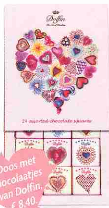
• Doos met chocolaatjes van Dolfin, € 8,40.