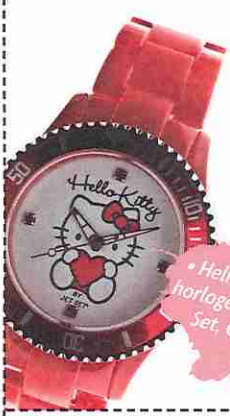
• Hello Kitty-horloge van Jet Set, € 59.