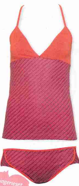
• Lingerie set van Skunkfunk, € 90.