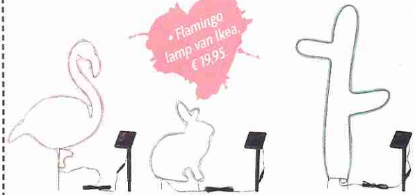
• Flamingo lamp van Ikea, € 19,95.