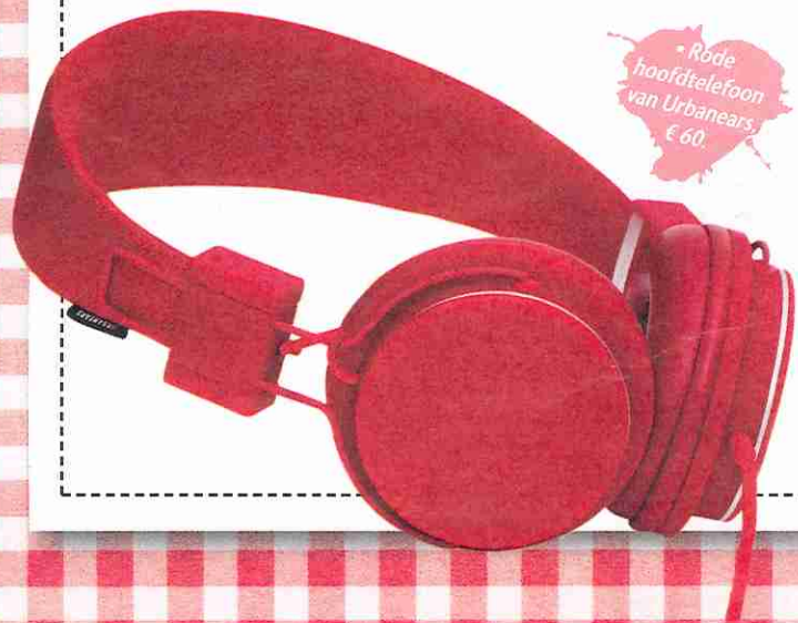
• Rode hoofdtelefoon van Urbanears, € 60.