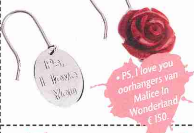
• PS, I love you oorhangers van Malice In Wonderland, € 150.