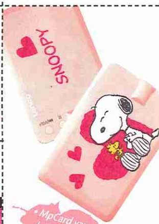
• Mp Card van Lenco met Snoopy, vanaf € 25.