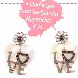
• Oorhanger met hartjes van Hypnochic, € 35.