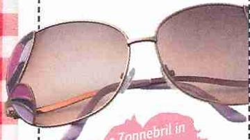
• Zonnebril in roze van New Look, € 9,99.