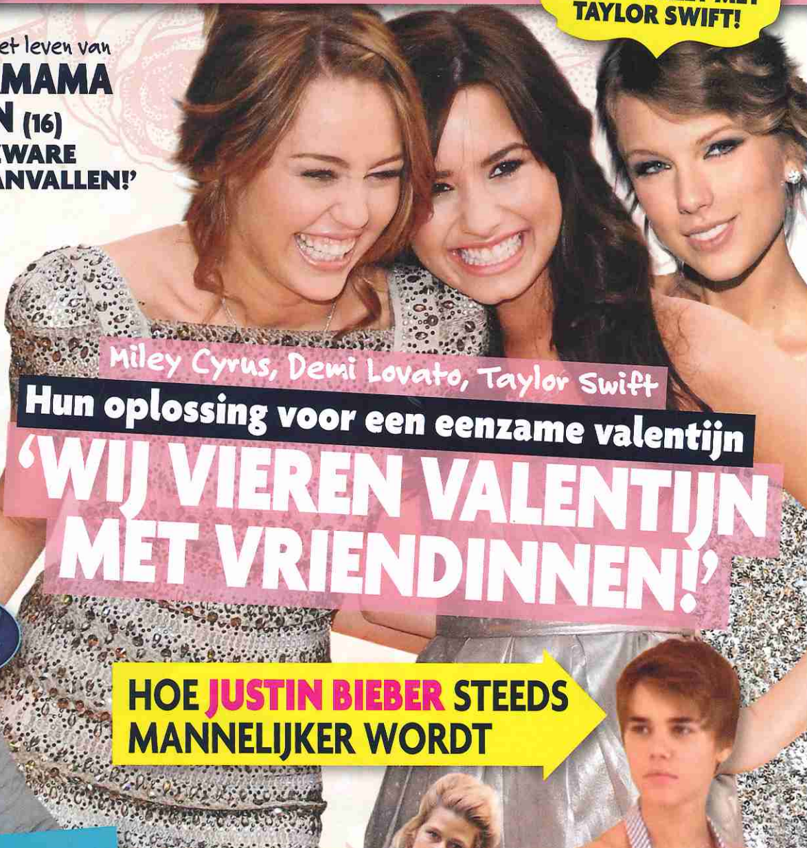
Miley Cyrus, Demi Lovato, Taylor Swift

Dit moet jij weten 12 MANIEREN OM INDRUK OP HEM TE MAKEN