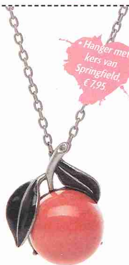
• Hanger met kers van Springfield, € 7,95.