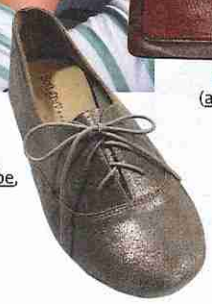
Derbys en cuir doré ( laredoute.be , 79,99 €).

LES PLUS CHOUETTES SITES VINTAGE topvintage.nl : intéressant surtout pour la super collection de bottes et escarpins. frousfrous.nl : des pièces uniques, neuves et de seconde main. lilycloset.nl : des vêtements et accessoires neufs et de seconde main. ilovevintage.nl : une sélection des meilleures pièces du magasin d'Amsterdam. verrycherry.nl : des fringues neuves mais inspirées des fifties.