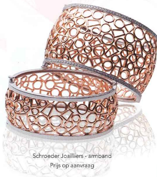
Schroeder Joailliers - armband Prijs op aanvraag