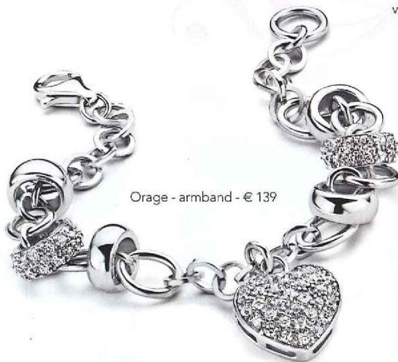
Orage - armband - € 139