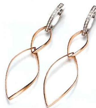
Mattioli oorbellen - € 1.895