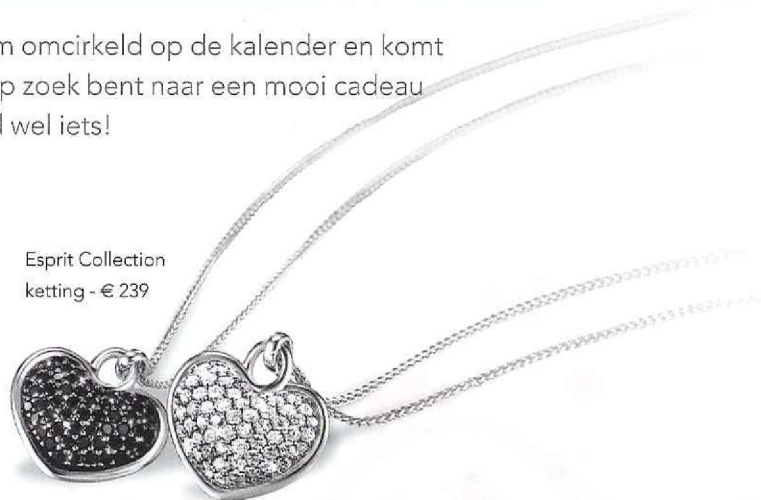
Esprit Collection ketting - € 239