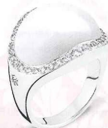
Mont Blanc - ring € 5.100