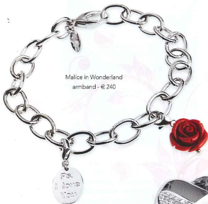
Malice in Wonderland armband - € 240

14 februari wordt jaarlijks in hartjesvorm omcirkeld op de kalender en komt alweer om de hoek kijken. Als je nog op zoek bent naar een mooi cadeau voor Valentijn, vind je hier ongetwijfeld wel iets!