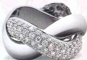
Poiray - ring vanaf € 4.900