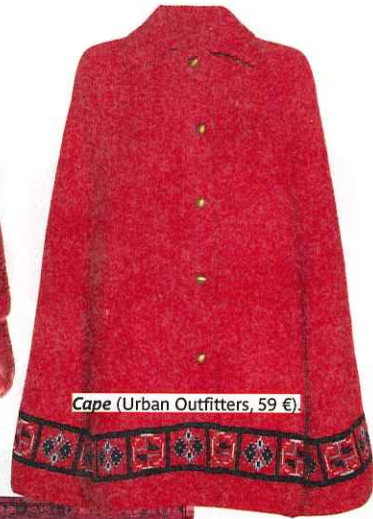
Cape (Urban Outfitters, 59 €).