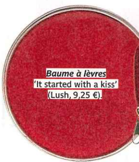
Baume à lèvres 'It started with a kiss' (Lush, 9,25 €).