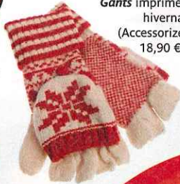
Gants imprimés hivernal (Accessorize, 18,90 €).