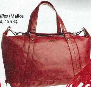
Sac XL (Mango, 49,90 €).