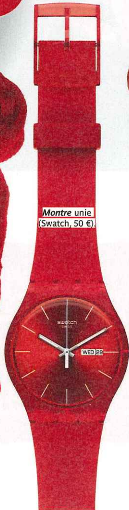
Montre unie (Swatch, 50 €).