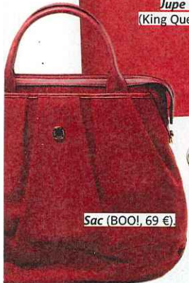
Sac (BOO!, 69 €).