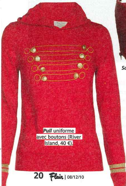
Pull uniforme avec boutons (River Island, 40 €).