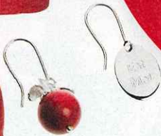
Boucles d'oreilles (Malice in Wonderland, 155 €).