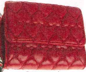
Porte-monnaie (Accessorize, 18,90 €).