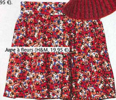
Jupe à fleurs (H&M, 19,95 €).