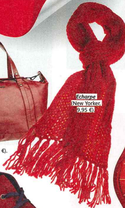
Echarpe (New Yorker, 9,95 €).