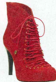
Escarpins (Sacha, 74,95 €).