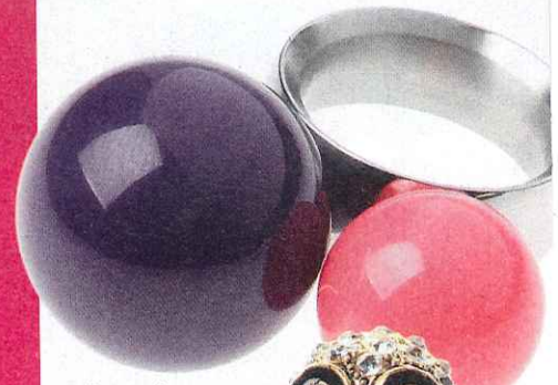
Zilveren ring met wisselbare bijjartballen - € 170 - Tamawa.

VERSCHILLENDE RINGEN BIJ ELKAAR, GESWICHTE OORRINGSETJES... TAKE YOUR PICK EN MIX EN MATCH À VOLONTÉ.