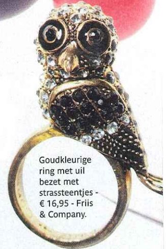
Goudkleurige ring met uil bezet met strassteentjes - € 16,95 - Friis & Company.