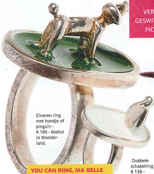
Zilveren ring met hondje of pinguïn - € 180 - Malice in Wonderland.