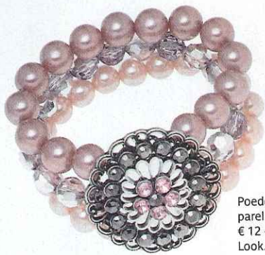
Poederroze parelring - € 12 - New Look.