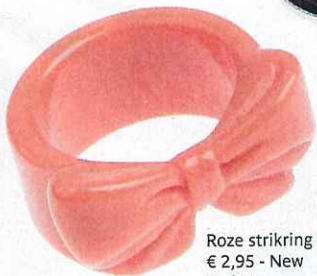
Roze strikring - € 2,95 - New Yorker.