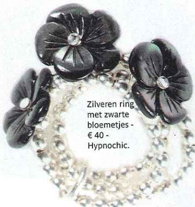
Zilveren ring met zwarte bloemetjes - € 40 - Hypnochic.