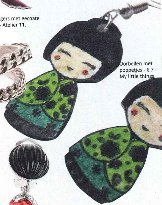
Oorbellen met poppetjes - € 7 - My little things.