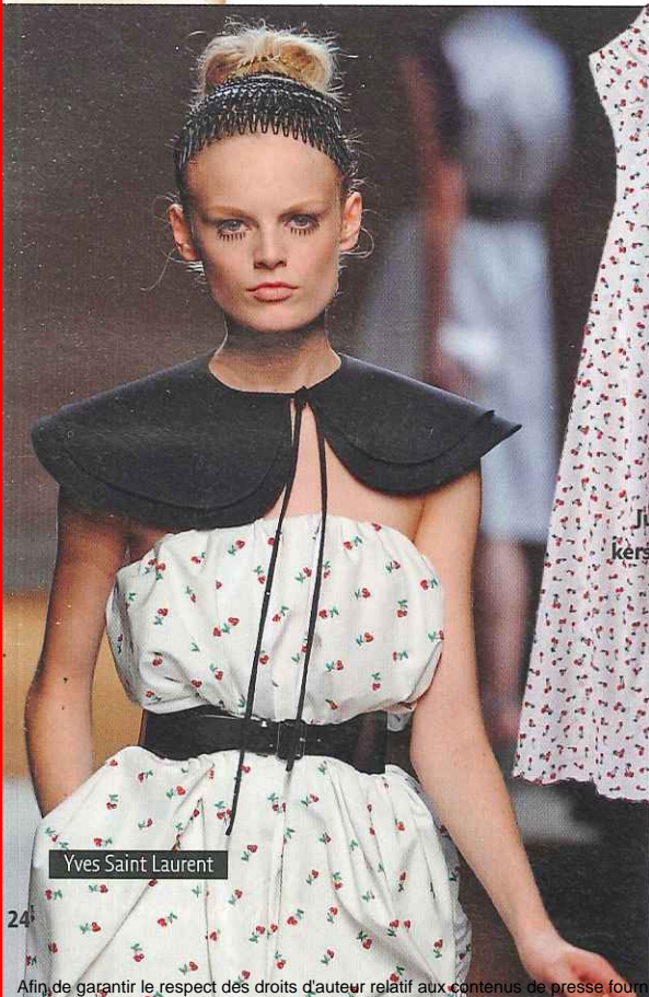
Yves Saint Laurent

Everybody loves cherries. Vooraf als ze in een praline met rood wikkeltje zitten. Doe ons nog een cherry cola en deze YSL-jurk - da's pas juicy couture!