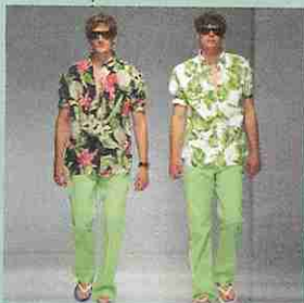
mode kleuren en prints